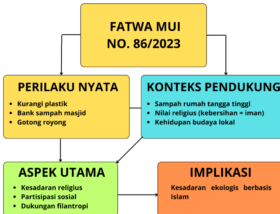
Gambar 1. Skema Integrasi Fatwa MUI No. 86/2023, Perilaku Nyata, dan Filantropi dalam Kesadaran Lingkungan

Setelah melihat bagan di atas, dapat dipahami bahwa implementasi Fatwa MUI No. 86/2023 tidak hanya berhenti pada tataran normatif, tetapi membentuk alur yang sistematis dari