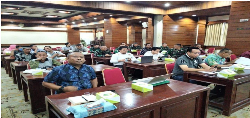
Gambar 4. Acara mediasi yang difasilitasi oleh DLH Kota Semarang