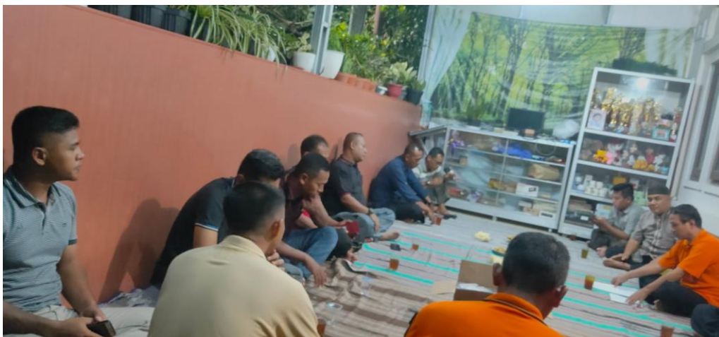
Gambar 2. Rapat Warga PGR RT 04,05 & 06 dan tokoh agama terkait pencemaran Lingkungan

Peran aktif beliau dalam gerakan ini tidak hanya terbatas pada sosialisasi dan edukasi, tetapi juga dalam melakukan advokasi terhadap pihak-pihak terkait, termasuk pemerintah dan perusahaan yang berpotensi merusak lingkungan.