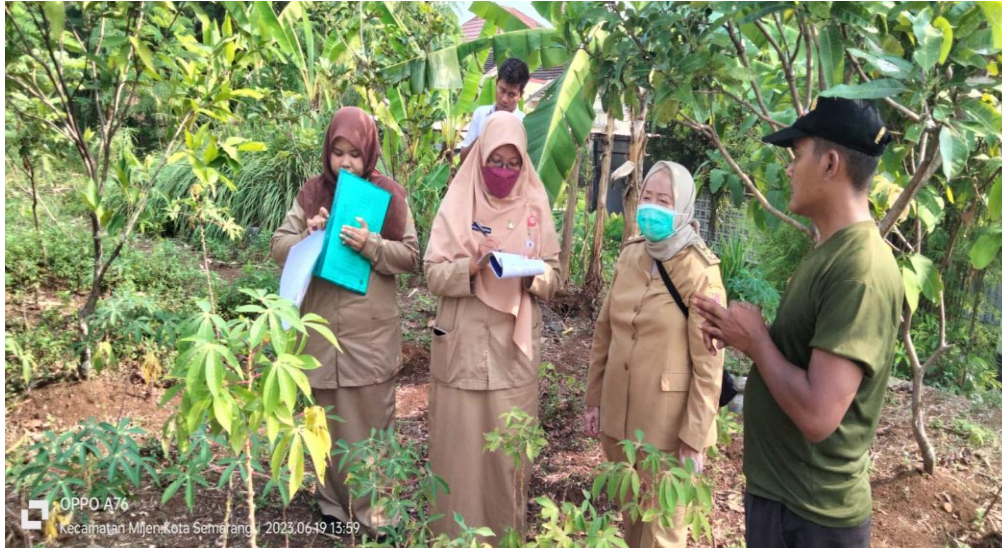
Gambar 3. Survei oleh DLH Kota Semarang di PGR terkait pencemaran lingkungan

untuk mengidentifikasi secara langsung proses pencemaran yang terjadi di sekitar lokasi operasional perusahaan. Langkah ini merupakan bagian dari upaya pemantauan rutin terhadap kepatuhan perusahaan terhadap regulasi lingkungan yang berlaku, serta untuk mendeteksi potensi dampak negatif terhadap kualitas udara, air, dan kebersihan lingkungan yang dapat merugikan masyarakat sekitar.